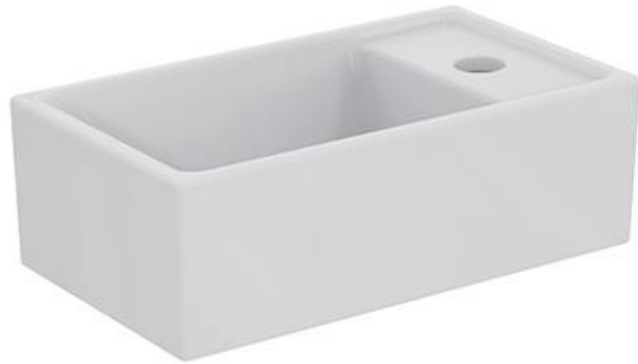
Ideal Standard Fontein 37cm x 21 cm met kraangat rechts, wit