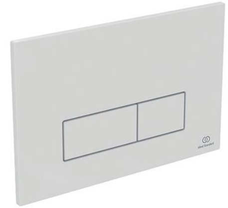
Ideal Standard Bedieningspaneel Oleas M2 wit