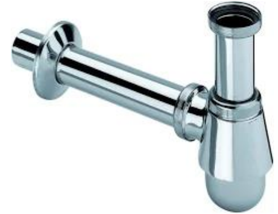
Viega Plugbekersifon met muurbuis en rozet, chrom